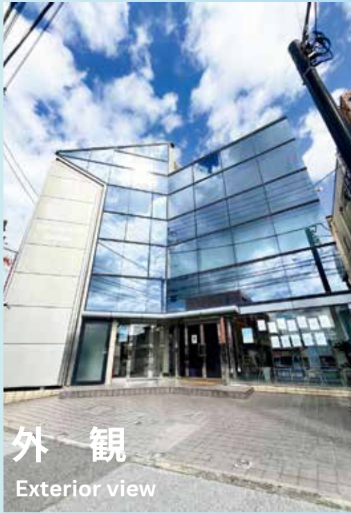
外観 Exterior view