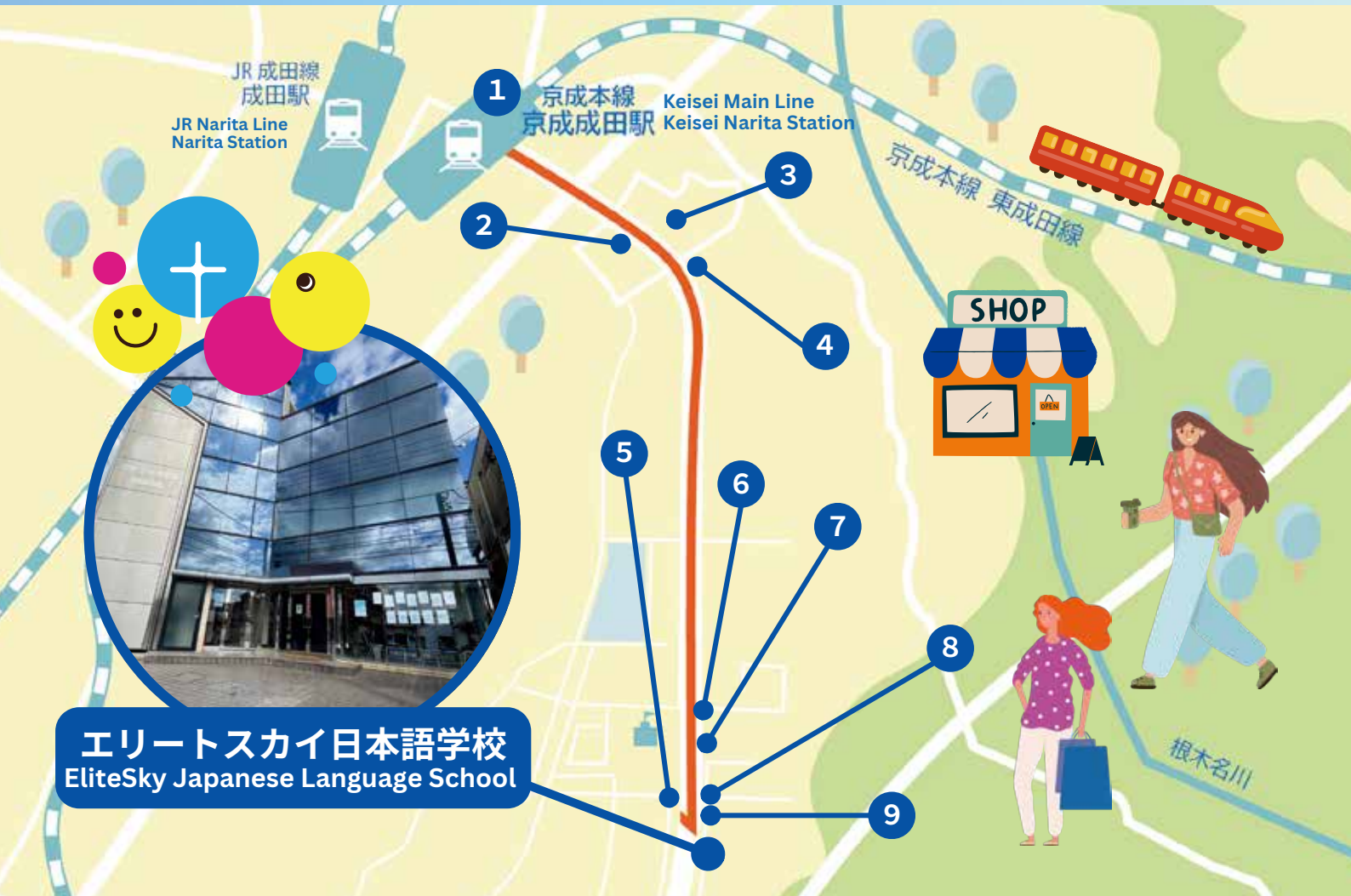
エリートスカイ日本語学校 EliteSky Japanese Language School

Our school is located in Tomisato City, which is rich in nature. The area around the school is a quiet environment suitable for learning. The nearest station to the school is Keisei Narita Station. This area is close to the airport and has good access, giving it an international atmosphere. You can enjoy the scenery of the four seasons, and the local festivals are fascinating. In addition, Narita is a town that has flourished for a long time and is dotted with historical sites. There are also plenty of shopping facilities and restaurants where you can enjoy local cuisine and products, so you can experience the Japan way of life. The city is safe, clean, well served by public transport and offers a convenient lifestyle.