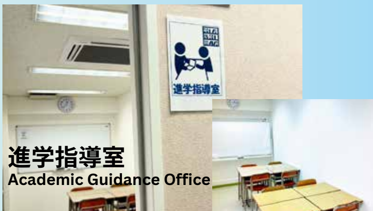
進学指導室 Academic Guidance Office