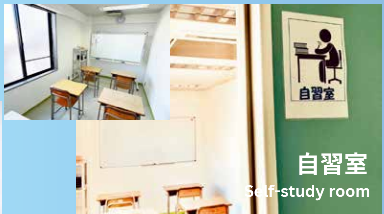
自習室 Self-study room